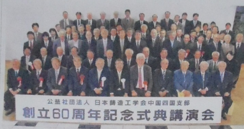
日本鑄造工学会中国四国支部創立60周年記念式典に参加した皆さん