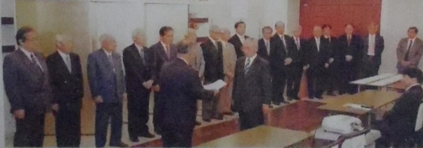
中国四国支部創立60周年個人表彰